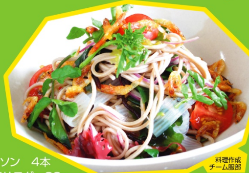
料理作成 チーム服部

芽ひじき、海藻サラダは水に20分くらい浸し、水気を切ります。ミニトマトは半分に切り、